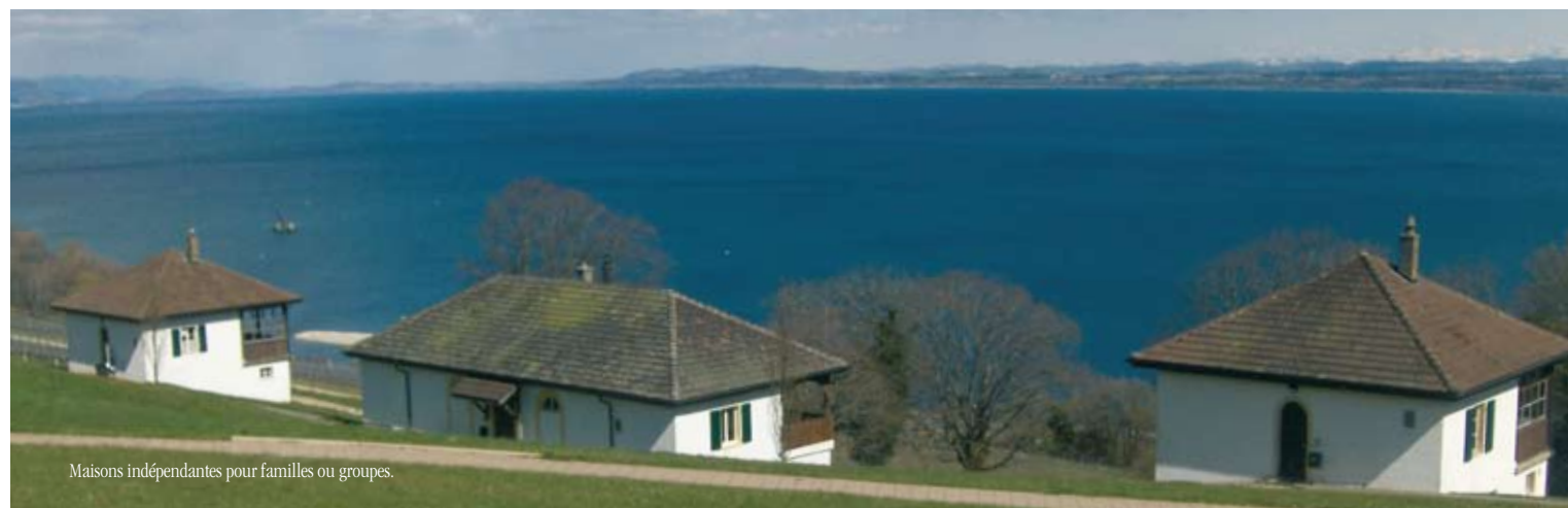
Maisons indépendantes pour familles ou groupes.

Divers terrains de sports et un environnement propice aux jeux et promenades sans limites.